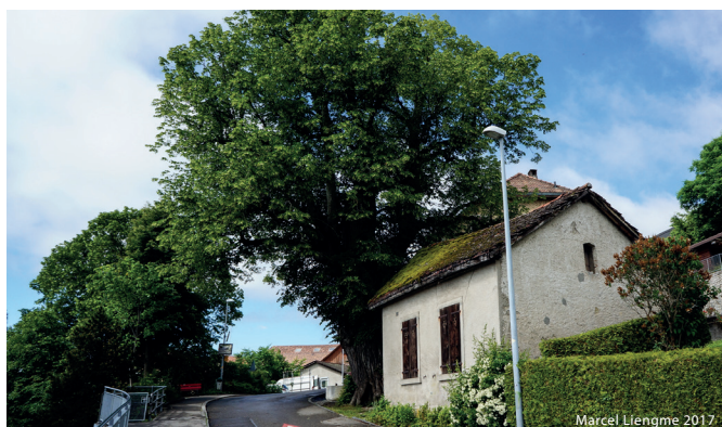
Schützenswerter Einzelbaum in Evillard