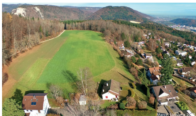
Ergänzung Landschaftsschutzgebiet in Evillard